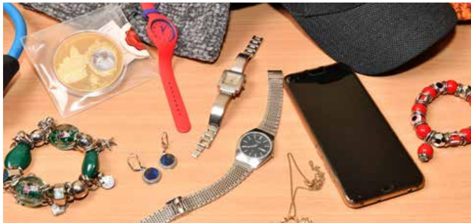
Wertvolles, Schönes und Kurioses ist bei der Online-Fundsachenversteigerung im Angebot.

Angeboten werden Fundsachen, für die nach der gesetzlichen Aufbewahrungsfrist von sechs Monaten kein Eigentümer gefunden wurde. Darunter sind Fahrräder, echter Schmuck, Handys oder auch Lackabziehbilder für E-Autos.