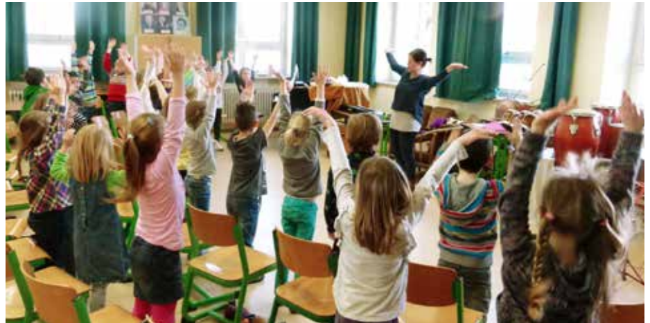
Wann wird wieder gesungen in den Singklassen?

Die Sing- und Musikschule hat die Coronapandemie bislang relativ gut überstanden. Der Rückgang der Schülerzahlen hält sich noch in Grenzen. Dazu trägt die Stadt Kaufbeuren maßgeblich bei, indem sie in der Zeit des online erteilten Ersatzunterrichts nicht die üblichen Unterrichtsgebühren berechnet. Doch die Wechsel zwischen Lockdown und Unterricht unter Hygieneschutzbestimmungen haben nicht nur wirtschaftliche Spuren hinterlassen.