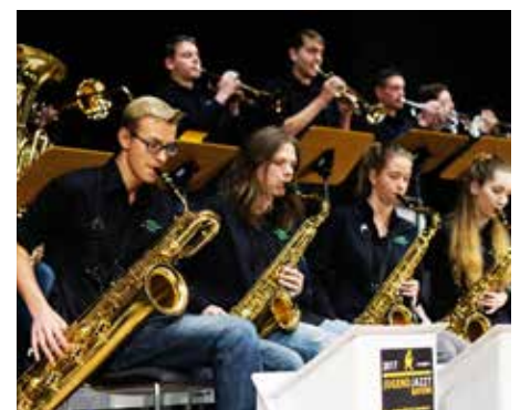
Monatelang keine Proben und Konzerte: Auch beim Kammerorchester und in der Bigband der Sing- und Musikschule spürt man die Folgen der Pandemie.