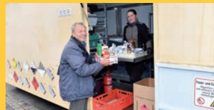
Das Giftmobil.

Das Giftmobil steht zwischen 08:30 und 12:00 Uhr am Bauhof in der Liegnitzer Straße für Sie bereit! Bei Rückfragen steht Ihnen die Abfallberatung unter Telefon 08341/437-513 zur Verfügung!