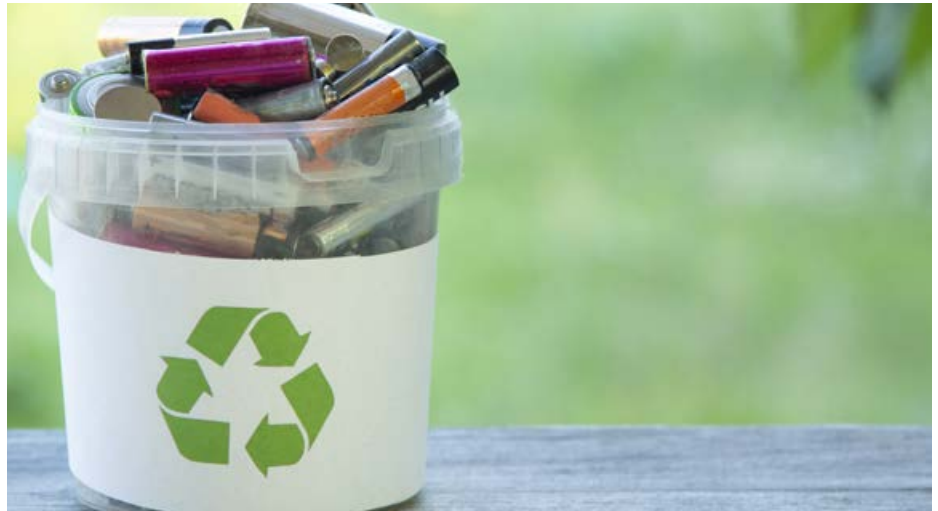
Die richtige Entsorgung von Batterien hilft, Ressourcen zu sparen.

Eine Batterie liefert, genau wie ein Akku, Strom für mobile Anwendungen jenseits der Steckdose. Im Unterschied zu den wieder aufladbaren Akkus können Batterien jedoch nicht wieder aufgeladen werden. Sie müssen am Ende ihrer Lebensdauer fachgerecht entsorgt werden. Dabei sind nicht wieder aufladbare Batterien eine sehr ineffiziente Art und Weise der Stromnutzung. Bei Ihrer Produktion wird 40 bis 500-mal mehr Energie benötigt als später bei der Nutzung zur Verfügung steht. Die Kosten für den Strom sind somit im Vergleich zu Energie aus der Steckdose mindestens 250-mal teurer. Eine bessere Alternative ist die Nutzung von Akkus für mobile Geräte, sofern eine Nutzung in dem jeweiligen Gerät möglich ist. Batterien und Akkus enthalten giftige, aber auch wertvolle Stoffe. Ein Großteil davon kann wiederverwertet