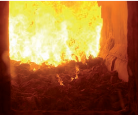
Blick in den Brennraum.

Auch die entstandene Schlacke wird aufbereitet, so dass Eisen und andere wertvolle Metalle dem Stoffstrom nicht verloren gehen. So leisten Anlagen dieser Art einen wesentlichen Beitrag zur Ressourceneffizienz.