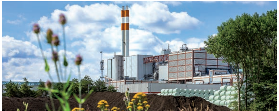
Müllheizkraftwerk zur thermischen Verwertung von Restmüll.

Durch bestehende Kooperationen wird dieser zu je 50 Prozent in Kempten und Augsburg in den jeweiligen Müllheizkraftwerken thermisch behandelt. Durch die hohen Temperaturen werden enthaltene Schadstoffe zerstört. In einer nachgeschalteten Rauchgasreinigung, die den größten Teil des Kraftwerkes ausmacht, wird die Abluft