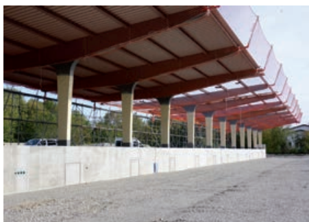
Der Rohbau des neuen Wertstoffzentrums im Oktober 2023.

Das durchgängige Dach bietet Schutz vor jeder Witterung. Durch die Anordnung von Anfahrts- und Abladerampe sind eventuelle Behinderungen zwischen Besuchern und dem Transportverkehr ausgeschlossen. Außerdem wird auf der über 2.000 Quadratmeter großen Dachfläche eine Photovoltaik-Anlage installiert, die nicht nur das neue Wertstoffzentrum, sondern auch das Klärwerk mit Strom versorgt. Die Kosten des Neubaus belaufen sich auf rund fünf Millionen Euro.