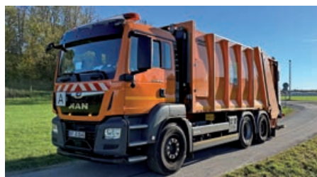
Anlieferung des Restmülls.

gefiltert, so dass diese an die Umgebung abgegeben werden kann.